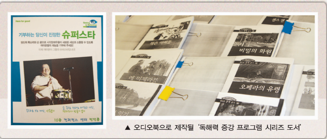
▲ 오디오북으로 제작될 '독해력 증강 프로그램 시리즈 도서'