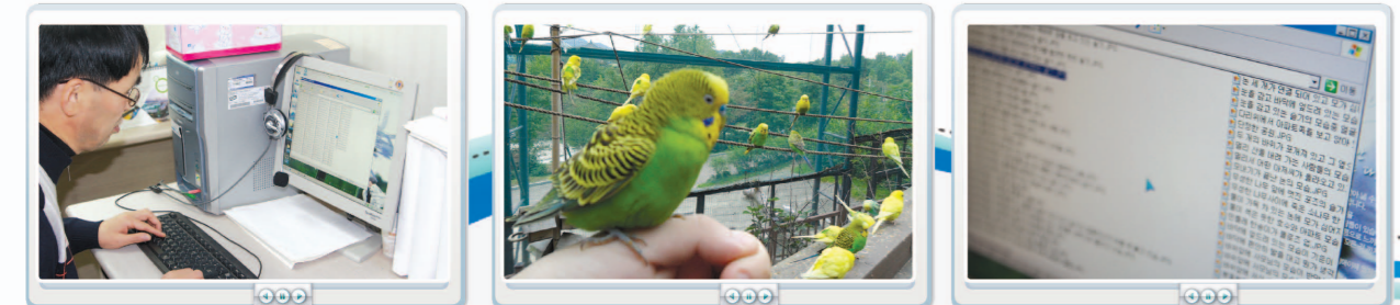
김경식 시인(가) 앵무새 사진의 내용을 자세히 설명해주는 파일명