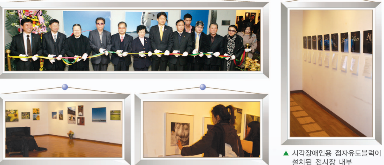
▲ 시각장애인용 점자유도블럭이 설치된 전시장 내부