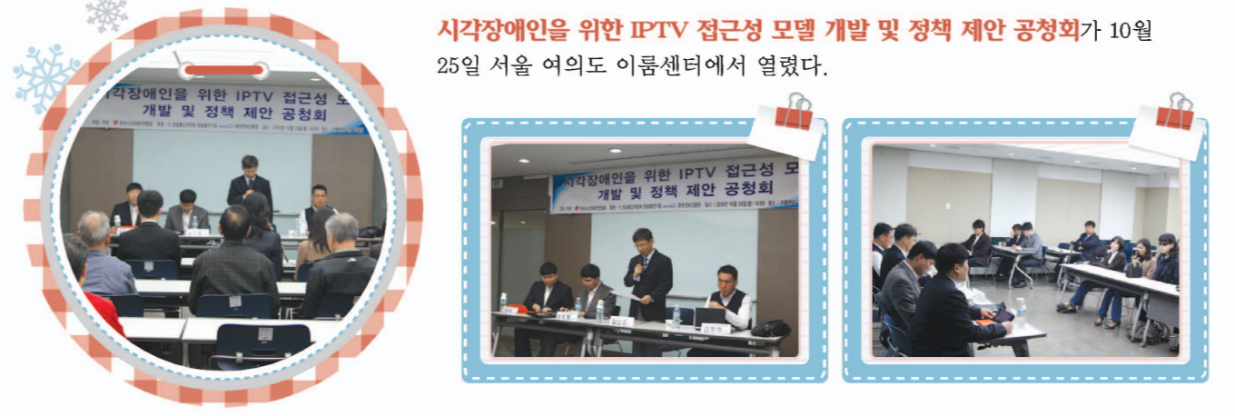
시각장애인을 위한 IPTV 접근성 모델 개발 및 정책 제안 공청회가 10월 25일 서울 여의도 이룸센터에서 열렸다.