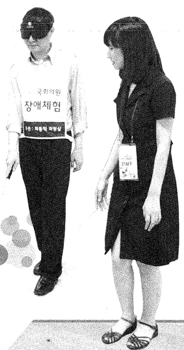
시각장애 체험을 하고 있는 김성주의원 ▶