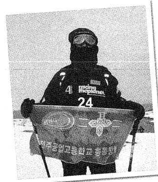
▲ 남극마라톤대회 참가 당시