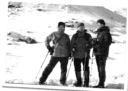
▲ 안나푸르나 정상에서 (사진 맨 오른쪽)