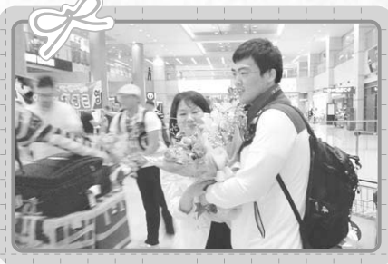
▲ 지난 9월 5일 귀국환영식 장면