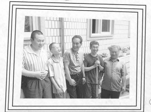
▲ 시각장애인 원생들과 함께