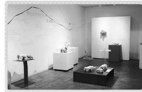
▲ '우리들의 눈' 갤러리 전경

개인 회화작업과 협회 대표로서의 활동까지, 누구보다 바쁜 시간을 보내고 있는 그녀는 실 때 도 시각장애인 예술 프로그램을 구상할 만큼 열정을 쏟고 있다. 엄 대표는 시각장애인들이 문화생활을 멀게만 느끼지 말고 마실 나가듯 편하게 즐겼으면 한다는 바람을 전했다.