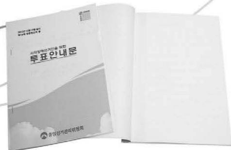
시각장애인용 선거공보물 ▶

시각장애 아이들에게 17년간 미술을 가르치며 시각장애인과 미술 사이의 거리를 좁혀온