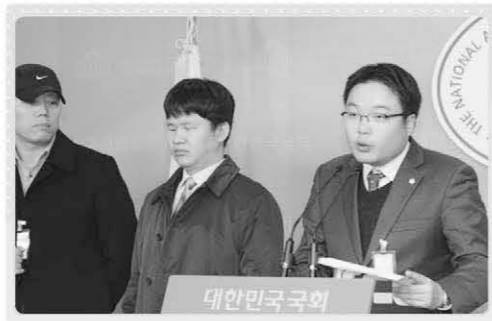
▲ 장애우권익문제연구소와 한국시각장애인연합회의 공직선거법 헌법소원 기자회견 장면