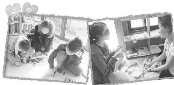
◀ ‘힐링캠프 촉촉’ 교육장면