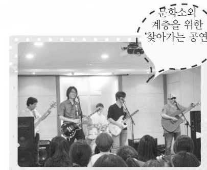
문화소의 계층을 위한 '찾아가는 공연'

4번출구 멤버들이 밴드를 결성하고 지금까지 활동하는 이유는 오직 한 가지, 밴드 이름의 뜻대로 희망을 전하기 위해서입니다. 그래서 이들은 매년 자선콘서트를 개최하고 문화소외계층을 위해 보육원 등을 방문하는 '찾아가는 공연'을 계속하고 있습니다.