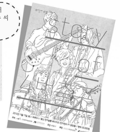
2012년 자선콘서트 'story of 4번출구' 포스터 ▶