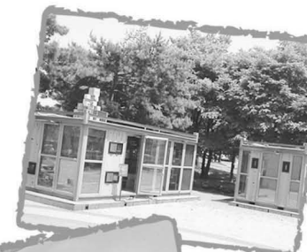
느리게 읽는 미술책방 ▶

2012년에는 시각장애인에게 직접 교육을 하는 것과 달리 시각장애인들을 교육하고 봉사하고자 하는 이들을 대상으로 장애체험·점자교육 등 매개자교육프로그램 ‘힐링캠프 촉촉’을 진행했으며, 이에 대한 결과보고 전시회를 지난해 12월 15일부터 25일까지 개최했습니다.