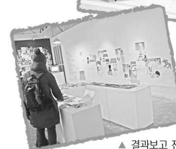
▲ 결과보고 전시회 전경