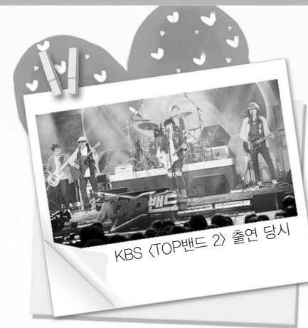
KBS <TOP밴드 2> 출연 당시

KBS 프로그램 <TOP밴드 2>에서 감동의 무대를 보여준 시각장애인 밴드 '4번출구'