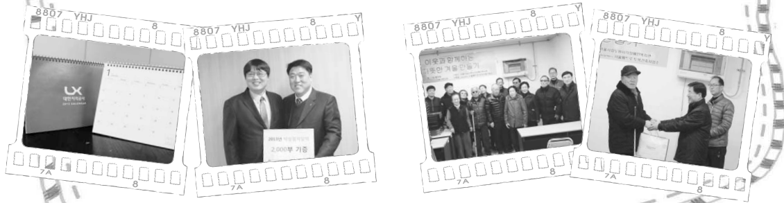
▲ LX대한지적공사 달력 및 전달식

연말연시를 맞아 시각장애인을 향한 온정의 손길이 이어졌습니다. LX대한지적공사에서는 저시력장애인을 위한 달력 2,000부를, 서울메트로 토목건축사업소에서는 내의 100벌을 기증했습니다.