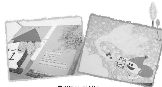
▲ 촉각도서 전시물