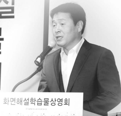
▶ 상영회에 참석한 기동민 서울시 정무부시장