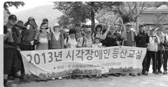
시각장애인 등산교육에 참가한 시각장애 참가자와 봉사자들