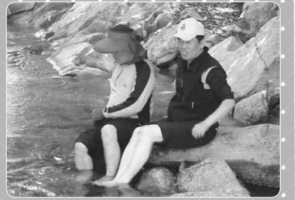
▲ 유명산 어비계곡에서 발을 담궈고 있는 시각장애 참가자