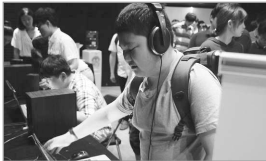
▲ 화면해설 학습물을 체험하는 시각장애학생

화면해설 학습물 상영회에서는 학생들이 직접 체험해볼 수 있는 EBS 수능 화면해설 체험존 이 설치되었습니다. 뿐만 아니라 화면해설 학습물로 공부하여 대학진학에 성공한 선배와의 만남, 화면해설 애니메이션 관람 등 다채로운 체험이 이어졌습니다. 화면해설 학습물이 시각장애학생들의 학습권 향상에 많은 도움이 될 것으로 기대됩니다.