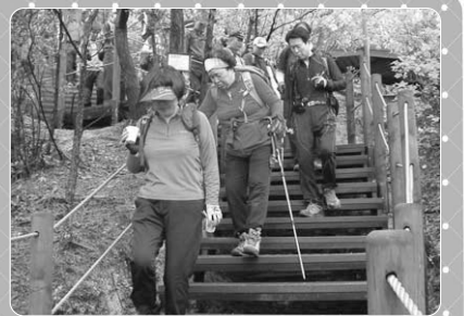
▲ 봉사자와 함께 등산 중인 시각장애 참가자