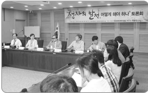
▲ '점자의 발전, 어떻게 해야 하나' 토론회 모습

토론회에 참가한 많은 분들이 점자의 우수성과 점자기본법 제정에 대한 필요성 을 말씀해주셨습니다. 토론회에 참가한 많은 분들의 의견이 반영되어 시각장애인의 점자 사용에 도움이 있기를 바랍니다.