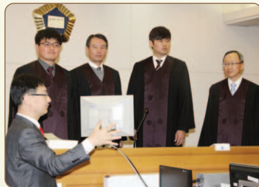
법정 견학 중인 1일 명예법관