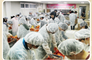
노원시각장애인복지관에서 김치를 담그는 모습