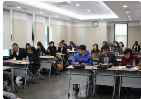
한국점자규정개정을 위한 공청회 모습