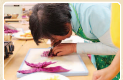
칼을 이용해 채소를切的 참가자