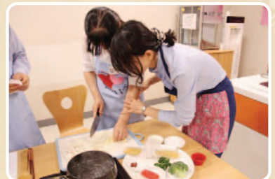
생활요리교실에 참가중인 여성시각장애인