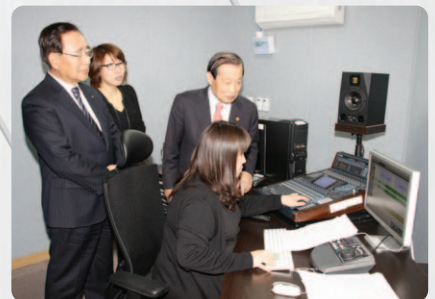
화면해설방송센터를 직접 방문하는 모습